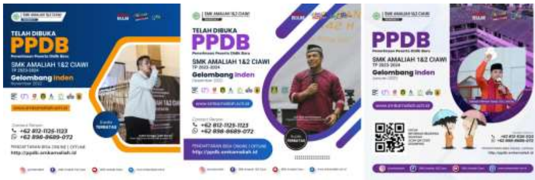
Gambar 2. Flyer Influencer

Influencer marketing telah menjadi tren efektif dalam membantu SMK Amaliah 1 Ciawi untuk mencapai target audiens yang lebih luas dan membangun kredibilitas ini ditunjukkan dengan adanya peningkatan dari jumlah like di media sosial SMK Amaliah 1 Ciawi salah satunya Instagram. Berikut like Instagram SMK Amaliah sebelum menggunakan foto influencer ditunjukkan dalam gambar 3.