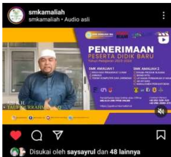
Gambar 4.8. Jumlah like sesudah menggunakan foto influencer

Berikut like Instagram SMK Amaliah sesudah menggunakan foto influencer ditunjukkan dalam gambar 4.