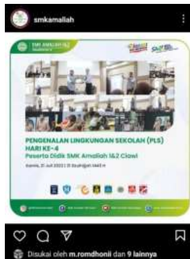
Gambar 3. Jumlah like sebelum menggunakan foto influencer

Influencer marketing telah menjadi tren efektif dalam membantu SMK Amaliah 1 Ciawi untuk mencapai target audiens yang lebih luas dan membangun kredibilitas ini ditunjukkan dengan adanya peningkatan dari jumlah like di media sosial SMK Amaliah 1 Ciawi salah satunya Instagram. Berikut like Instagram SMK Amaliah sebelum menggunakan foto influencer ditunjukkan dalam gambar 3.