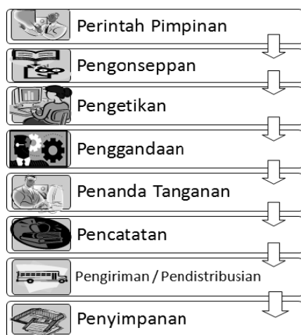
Gambar 2 Prosedur surat keluar

Dari hasil diskusi dengan pengurus PKK Karangasem RT 04 RW 12 muncul beberapa pertanyaan, seperti yang dikemukakan oleh Ibu Kusminiyati mengenai cara penulisan kode surat masuk dan surat keluar dari organisasi. Ibu-ibu sangat antusias dalam mendengarkan materi ini. Terlebih materi ini memang belum pernah didapatkan sebelumnya.