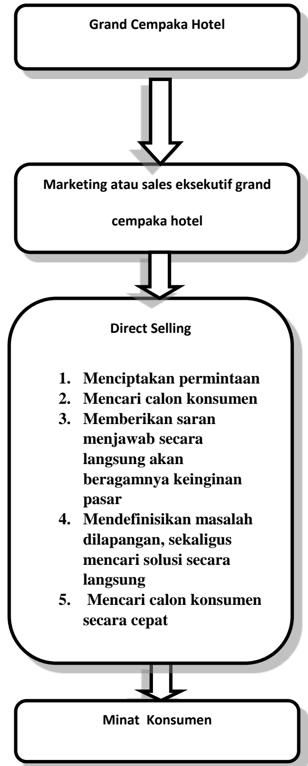
Gambar 1. Kerangka Berfikir Penelitian

Penelitian ini, dapat dilihat dari kerangka operasional, pada bagan dibawah ini Grand Cempaka Hotel memiliki promosi melalui direct selling yang dipromosikan oleh pihak marketing dan sales promotion Grand Cempaka Hotel Puncak Bogor.