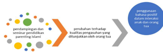
Gambar 2 Hasil Kegiatan

buktikan dengan intensifnya anak dalam mengikuti pelajaran di sekolah maupun les tambahan diluar jam sekolah. Anak lebih sering berinteraksi dan bertanya kepada guru dalam pembelajaran, serta meningkatnya kebiasaan penggunaan bahasa positif di lingkungan sehari-hari.