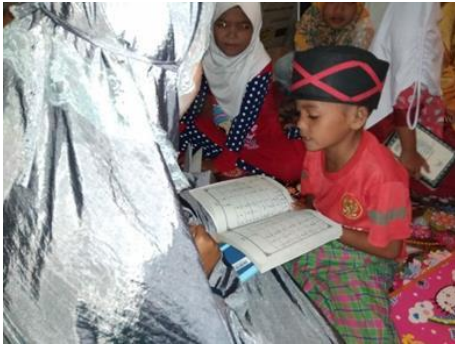
Gambar 3 Hapalan Surat-Surat Pendek Juz 30

Pembelajaran ini dilaksanakan dengan berbagai metode pendukung guna memudahkan pencapaian hafalan yang diprogramkan. Metode klasik, yakni pemberian bacaan yang kemudian anak dibimbing untuk menghafal. Metode rombel atau rubik surat, yakni mengacak urutan ayat pada sebuah surat dan anak diminta untuk menyusun ayat tersebut menjadi satu surat yang utuh. Metode ini dianggap cukup berhasil memberikan pengaruh kecepatan dan melekatnya ingatan hafalan karena membaca ayat dengan berulang kali. Metode selanjutnya adalah sambung ayat, metode ini melatih kemampuan anak dalam cepat tanggapnya anak. Metode terakhir adalah dengan menggunakannya reward atau penghargaan kepada anak. Pemberian reward ini adalah sebagai upaya meningkatkan motivasi anak dalam menghafal, karena dengan adanya pemberian reward anak lebih