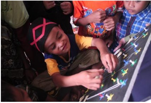
Gambar 2 Anak menggantungkan kartu bertali di papan Galaksi Impian