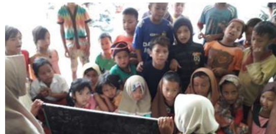
Gambar 4 Bentuk Kegiatan Pembelajaran

bermain dan bercengkrama dengan teman sebayanya. Pemberian teguran dilakukan dengan spontan atau secara langsung. Anak yang berkata tidak sopan atau kasar diberikan nasihat, serta masukan agar menggunakan bahasa yang santun dan lebih baik. Anak juga mendapat penjelasan tentang dampak dari penggunaan kata yang tidak baik ketika berbicara kepada teman yang lain. Pengajaran spontan dan secara langsung dianggap lebih efektif karena lebih tepat sasaran dan dapat diterima langsung oleh anak.