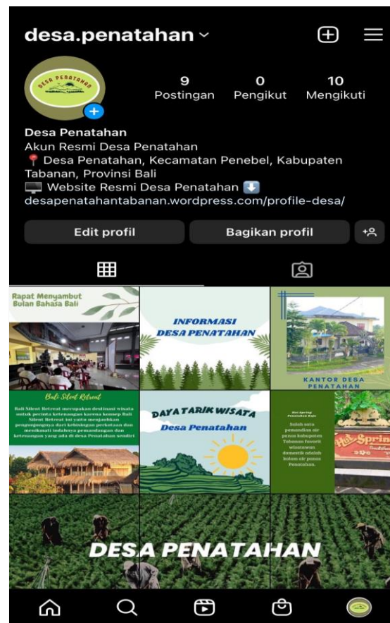
Gambar 3 Pembuatan Akun Instagram Desa Penatahan

Dalam tahapan ini masuk kepada Eksistensi Desa Penatahan dalam pembuatan Akun Instagram desa, dimulai dari pengunduhan Aplikasi yang tersedia melalui App Store maupun Playstore, pengunduhan aplikasi dengan menggunakan internet sebagai pendukung pengunduhan melalui Smartphone . Langkah selanjutnya dengan mengikuti prosedur pendaftaran diri yang terdiri atas nama pengguna serta kata sandi yang dibuat. Dalam hal ini, pihak Kepala Desa menyerahkan terkait nama pengguna dapat disesuaikan dengan Desa Penatahan, maka dibuatkannya nama akun resmi Instagram desa yaitu desa.penatahan . Disamping itu juga, dalam melengkapi identitas dari akun Instagram desa penatahan maka dibuatkannya Bio Instagram, bio disini mengacu kepada keterangan singkat mengenai identitas desa sebagai pengguna Instagram. Terdapat informasi yang jelas mengenai alamat desa dengan tautan web resmi desa penatahan yang berisikan informasi terkait sejarah, visi dan misi serta data kependudukan.