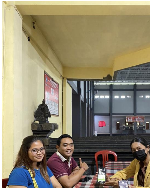
Gambar 4 Penyerahan Pengelolaan Akun Instagram Desa Penatahan

Instagram desa penatahan. Dalam unggahan setiap postingan juga disertai dengan hashtag. Hashtag berfungsi untuk menautkan dan mengelompokkan konten ataupun informasi yang sejenis, sehingga memudahkan dalam temu kembali (Noprianto & Prakoso, 2019).