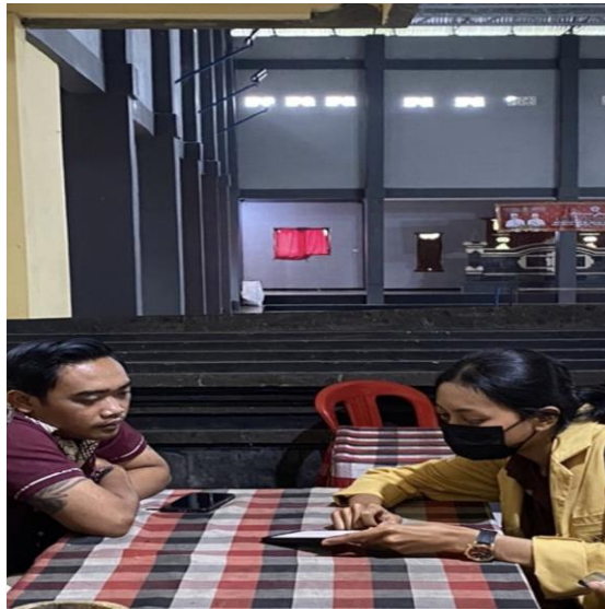
Gambar 2 Perencanaan diskusi pembuatan akun Instagram Desa Penatahan

dengan baik dengan adanya komunikasi 2 arah sebagaimana telah dilakukannya juga diskusi terkait konten apa saja yang dapat di unggah dalam akun tersebut oleh Sekretaris Desa dimana beliau juga telah paham mengenai fitur-fitur yang terdapat dalam Instagram, Caption yang dapat digunakan dengan menggunakan gaya bahasa yang sesuai dengan konten. Gaya bahasa juga termasuk salah satu di antara unsur untuk membangun nilai keindahan sebuah bahasa dalam akun Instagram dalam segi makna maupun keindahan bunyi (Damayanti.R 2018). Dalam program Kerja ini, adapun tahapan-tahapan yang dilalui dalam pelaksanaannya diantaranya tahap perencanaan, tahap pembuatan akun, serta pengelolaan akun Instagram.