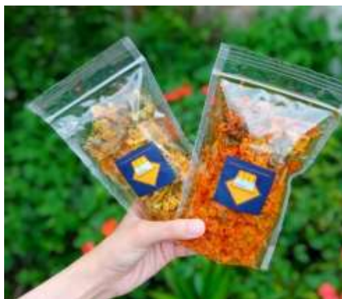
Gambar 2. Produk Keripik Kacang Panjang