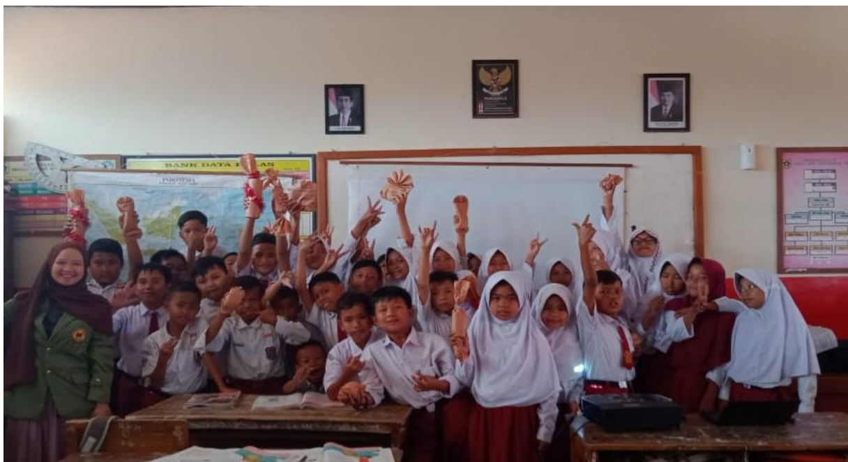
Gambar 3. Antusiasme Peserta dalam Kegiatan

Pelaksanaan kegiatan pengenalan Ekonomi Syariah dan gerakan mari menabung pada siswa sekolah dasar yang dilaksanakan di SDN Cimanggu 1 mendapatkan apresiasi dan antusias yang baik dari siswa-siswi maupun pihak sekolah tempat dimana kegiatan tersebut dilaksanakan. Kegiatan ini dilaksanakan di ruang kelas tertutup dengan menampilkan materi berupa powerpoint yang mampu memberikan efek fokus dan hal yang baru pada siswa-siswi sekolah dasar. Materi yang disampaikan diantaranya yaitu