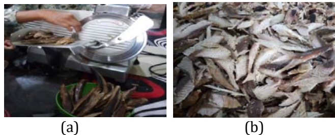
Gambar 2 (a) Pengirisan ikan menggunakan slicer ; (b) Hasil irisan ikan

Pada kegiatan ini, tim pengabdian memberikan alat pengiris ikan ( slicer ) (Gambar 2a) yang bertujuan untuk mempermudah proses persiapan bahan baku, mempersingkat waktu produksi dan meningkatkan jumlah produk yang dihasilkan, serta meningkatkan keseragaman ukuran irisan ikan yang dihasilkan.