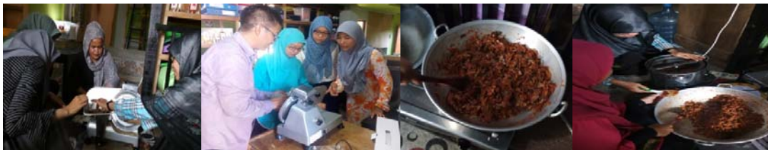
Gambar 1 Kegiatan pengabdian, pelatihan, dan pendampingan pengolahan Keumamah

Penyampaian materi dilakukan melalui diskusi dan praktik pembuatan keumamah menggunakan slicer dan spinner . Kedua mitra menunjukkan antusiasme yang tinggi dalam mengikuti kegiatan ini karena mereka sangat menginginkan peningkatan kualitas dan kuantitas produk keumamah yang mereka hasilkan. Penggunaan kedua alat tersebut dapat membantu mitra dalam mencapai tingkat produktivitas dan mutu keumamah yang mereka inginkan.