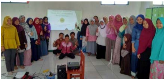
Gambar 2 Foto tim pelaksana pengabdian bersama mitra selesai penyuluhan