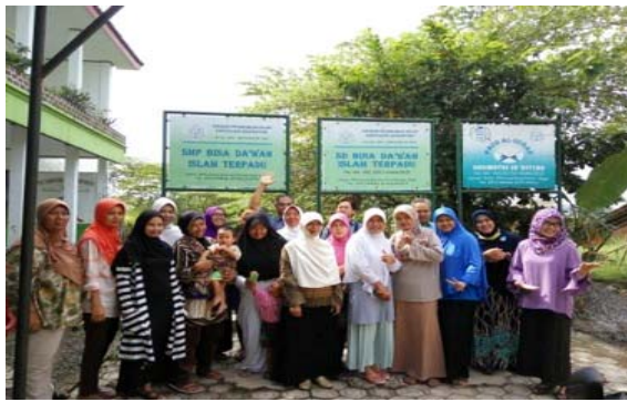
Gambar 1 Foto saat sosialisasi program dalam rangka membuat komitmen dari tim pengabdian pada masyarakat bersama masyarakat RW 10 Desa Leuwiliang

Sebelum melakukan penyuluhan Pembuatan tawas dari kaleng bekas minuman maka Tim IbM melakukan sosialisasi program dalam rangka membuat komitmen antara Tim Pengabdian Pada Masyarakat bersama Masyarakat RW 10 Desa Leuwiliang. Pada Gambar 1, Gambar 2, Gambar 3, Gambar 4, Gambar 5, Gambar 6, Gambar 7, Gambar 8, Gambar 9, dan Gambar 10 diperlihatkan foto pada saat sosialisasi program.