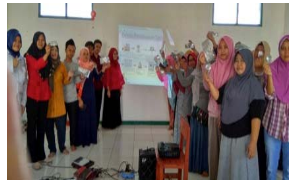
Gambar 5 Foto tim pelaksana bersama mitra setelah selesai proses pengampelasan