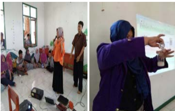
Gambar 7 Mitra melakukan proses reaksi antara potongan keleng bekas dengan KOH dan H 2 SO 4 dipandu oleh tim pelaksana IbM