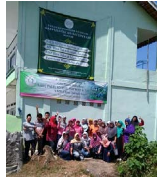
Gambar 10 Foto tim pelaksana pengabdian bersama mitra