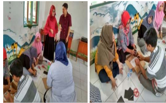
Gambar 4 Proses pengampelasan kaleng bekas minuman