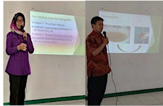
Gambar 3 Tim pelaksana pengabdian sedang memberikan penyuluhan pembuatan tawas