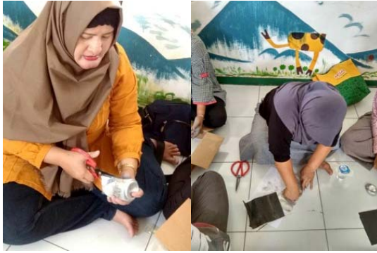
Gambar 6 Mitra sedang menggunting kaleng bekas minuman