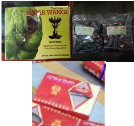
Gambar 8. Kertas Samson (Samson Kraft)