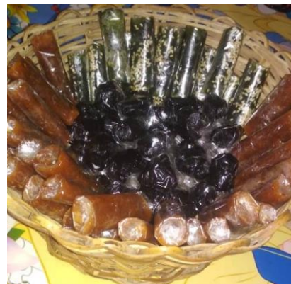
Gambar 2. Konten Produk Dodol SW pada Kemasan.

Fungsi informasi pada kemasan aneka dodol Sekar Wangi memuat pesan yang berisikan identitas dan informasi konten produk. Konten produk memuat komposisi, keterangan kadaluarsa, cara menyimpan, dan berat isi (Gambar 1). Hal ini sesuai dengan aturan ketentuan Undang-undang Label dan Pangan Tahun 1999 sehingga desain yang beredar di masyarakat memenuhi aspek hukum yang memuat informasi konten produk yang dikemas. Gambar 1. Produk dodol.