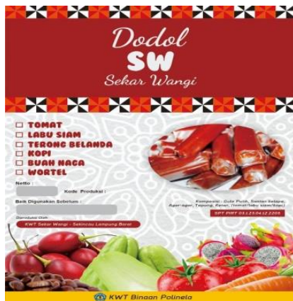
Gambar 5. Produk aneka dodol dalam kemasan plastik.