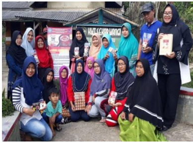
Gambar 8. Kegiatan Pelatihan Kemasan produk aneka dodol Sekar Wangi.

Pengemasan yang digunakan sebagai pelindung produk aneka dodol sebagai barang dagangan (niaga). Kemasan yang dibuat anggota ada beberapa yang rapi dan dapat diandalkan sebagai pembuat kemasan di KWT Sekar Wangi. Ketekunan dan ketelitian dalam membuat kemasan pada masing-masing anggota KWT, membuat semangat baru untuk mengembangkan pemasaran lebih luas.