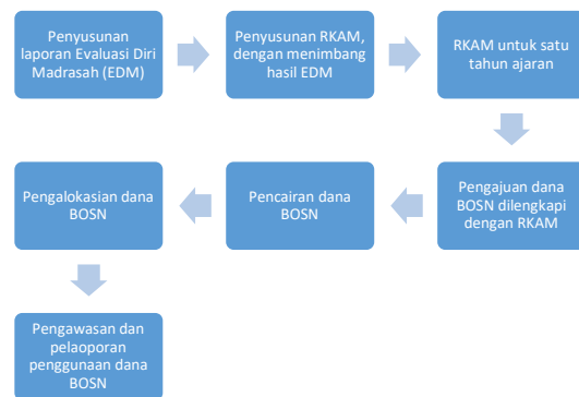
Gambar 1 Alur Pengelolaan Dana BOSN MI X Tahun 2022

Alur manajemen pengelolaan dana BOSN di MI X Bantul, Yogyakarta dapat digambarkan melalui bagan berikut ini