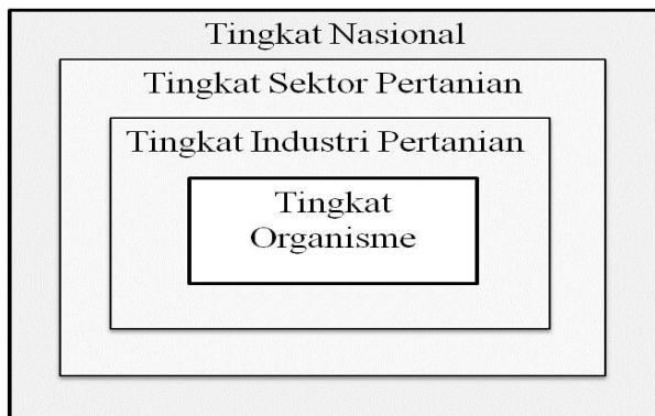
Gambar 1 Empat tingkat domain untuk menghadapi agroterorisme (ubahsuaikan dari Kohnen 2000).

Gambar dan grafik dibuat dalam format JPEG dan hanya diperbolehkan jika data hasil penelitian tidak dapat disajikan dalam bentuk tabel. Grafik yang dibuat dengan program microsoft office excel harus diubahsuaikan menjadi format JPEG dengan kualitas gambar yang layak cetak. Ukuran lebar gambar adalah 80 mm atau 160 mm. Judul gambar harus ringkas, jelas, dan informatif, diberi nomor urut angka arab, huruf kapital hanya pada huruf pertama judul gambar kecuali beberapa nama diri, dan ditempatkan di bagian bawah gambar. Contoh gambar berformat JPEG lebar 80 mm (Gambar 1).