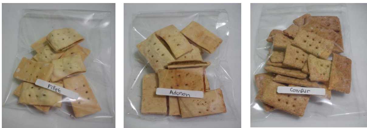
Gambar 3. Produk crackers belut dengan fillet , adonan dan campuran

Penelitian produk crackers belut digunakan pengujian deskriptif secara kuantitatif. Pada pengujian deskriptif terhadap ketiga produk crackers belut yaitu crackers belut dengan fillet , crackers belut dengan adonan dan crackers belut campur.