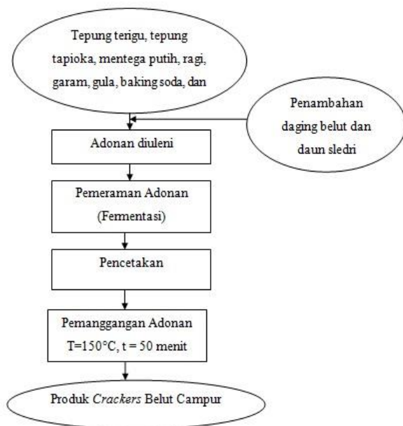
Gambar 2. Proses Pembuatan Crackers Belut Campur (Modifikasi Sri, 2012).