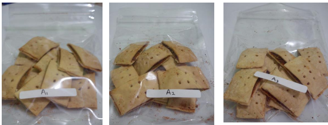
Gambar 4. Produk crackers belut dengan perlakuan kadar gula 10% (A1), 15% (A2) dan 20 % (A3)